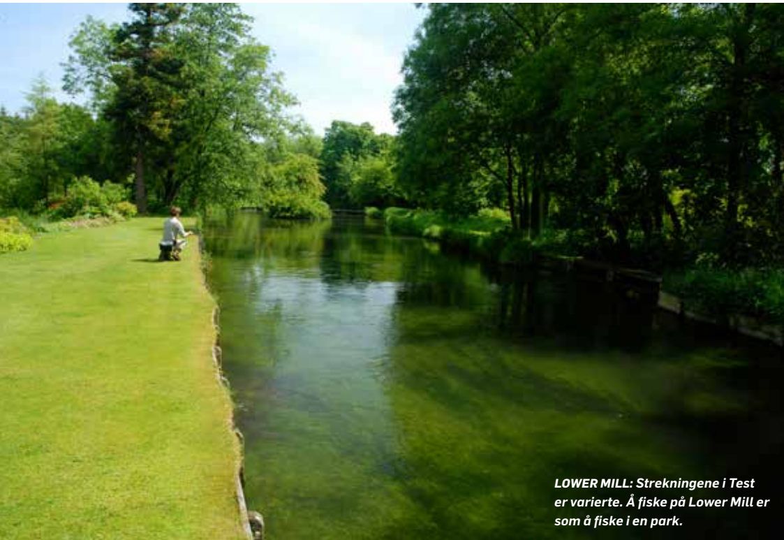
LOWER MILL: Strekningene i Test er varierte. Å fiske på Lower Mill er som å fiske i en park.