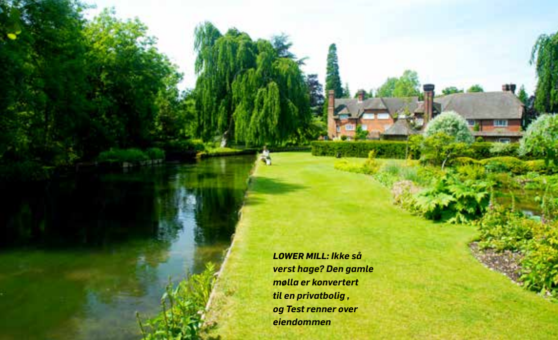
LOWER MILL: Ikke så verst hage? Den gamle mølla er konvertert til en privatbolig, og Test renner over eiendommen

stang. Prisen faller imidlertid betraktelig om du velger et mindre kjent beat, ei sideelv eller, som jeg anbefaler, reiser en annen tid på året. Da er antallet fluefiskere til å leve med – kalkelvene er gjerne flottere i juli og august enn på våren og tidlig sommer. Vannet er klarere og bunnvegetasjonen frodigere.